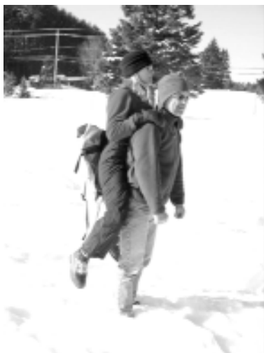
↑ Cacolet avec sac à dos.