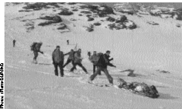
↑ Descente d'un traineau de fortune.