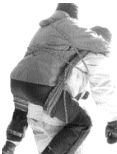
↑ Cacolet avec cordes.