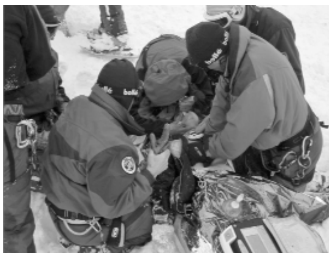
↑ Les voies aériennes sont dégagées, une réanimation est pratiquée. (Belledonne février 2004 - 2 morts).