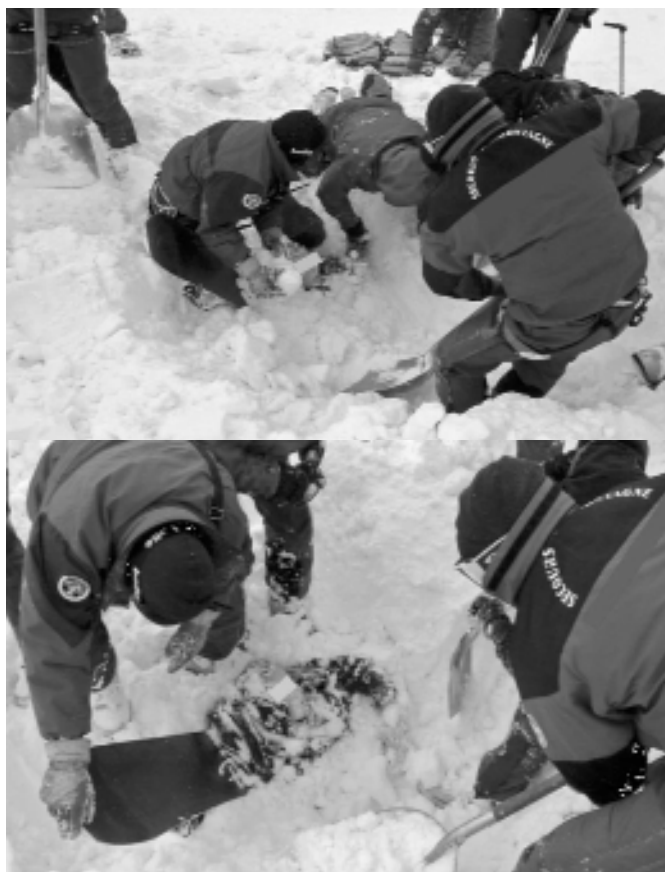
↑ Dégagement d'une victime ensevelie, son surf sur le dos, et vérification de la présence d'une cavité buccale.